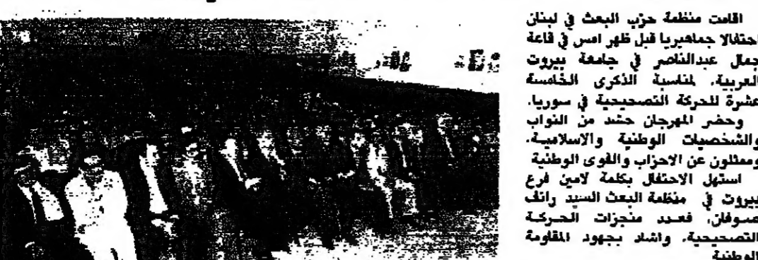
الحضور في المهرجان (محمود الخويلج)